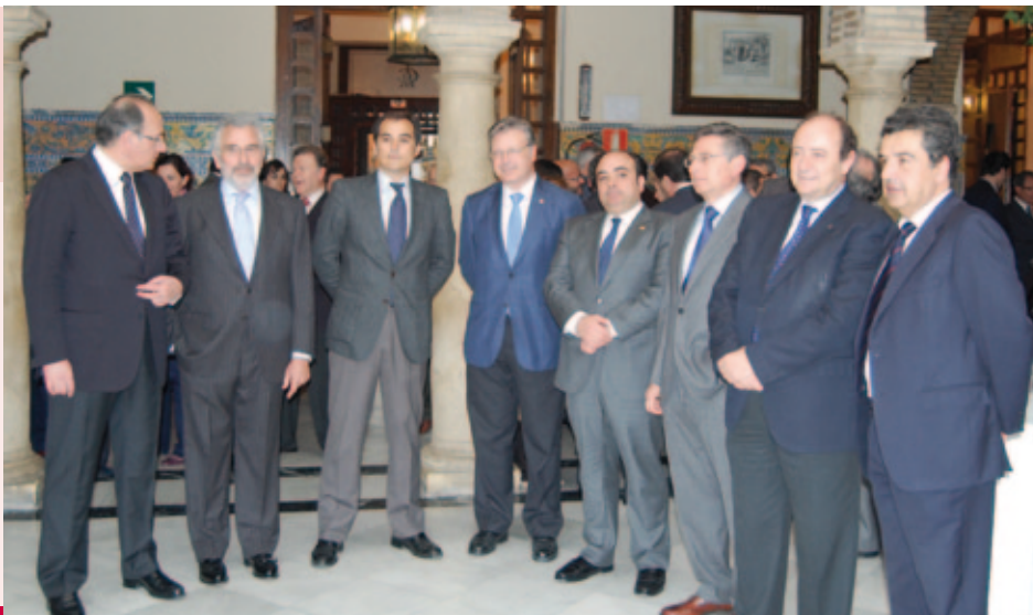
PRESENTACIÓN DE LA CORTE DE ARBITRAJE

ES UN PROYECTO COMÚN DE LA CÁMARA DE COMERCIO DE CÓRDOBA Y EL COLEGIO DE ABOGADOS CON EL FIN DE CREAR UN ÚNICO ÓRGANO DE ARBITRAJE PARA RESOLVER CONFLICTOS DE MANERA EXTRAJUDICIAL