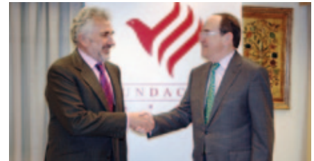
[ 8 de Abril ] CONVENIO CÁMARA-FUNDACIÓN CAJASUR

Con el convenio se pretende apoyar mediante pequeños créditos con condiciones