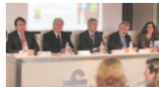
18 de Abril | PRESENTACIÓN ESTUDIO CASA ÁRABE

En las últimas dos décadas el llamado “nuevo capital árabe”, se ha sofisticado, especializado y profesionalizado y busca oportunidades atractivas en sectores como el inmobiliario de primera calidad, el sector del lujo, el financiero y las infraestructuras. El capital árabe también apuesta por sectores de innovación y alto nivel tecnológico como las energías renovables o la robótica,